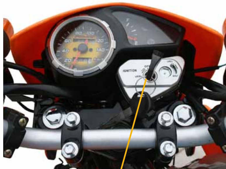
Llave de contacto

*Asegúrese que antes de rodar la motocicleta el soporte lateral esté completamente pegado.